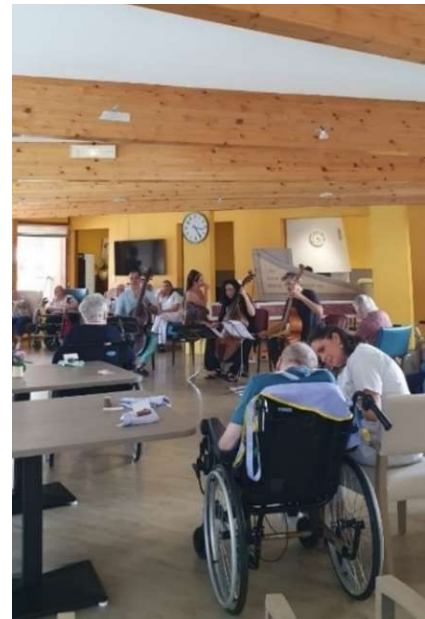
L'ensemble Vedado à l'EHPAD Les Cordeliers à Moûtiers lors de la 33 e édition du Festival (été 2024).

Le festival cherche à limiter l'impact carbone des concerts en proposant depuis l'an dernier un service de covoiturage . Par ailleurs, la programmation se fait de manière concertée avec les autres acteurs culturels du territoire afin d' optimiser les tournées des ensembles qui viennent de loin . À ce titre, une collaboration avec Musique et Nature en Bauges permet cette année d'accueillir le contre-ténor américain Reginald Mobley.