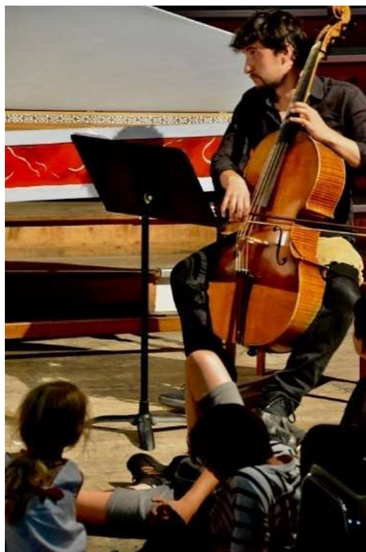
Des enfants se familiarisent avec la musique ancienne. Été 2019. Ensemble L'Escadron volant de la Reine. Basilique d'Aime.

À cet égard, nous proposons des spectacles où la musique ancienne rencontre d'autres esthétiques. Les Curious Bards , qui se font une spécialité de mêler musiques anciennes et traditionnelles, nous emmèneront sur les traces d'une étonnante musique ancienne scandinave. Le percussionniste d'origine iranienne Keyvan Chemirani rassemblera quant à lui un collectif d'artistes d'horizons divers – Iran, Grèce, Turquie, bassin méditerranéen – pour un spectacle interculturel où la danse soufie rencontrera les musiques baroques et improvisées. L' ensemble Prisma proposera un programme associant musiques baroques et traditionnelles anglaises autour de la figure de Henry Purcell. C'est ce même ensemble qui guidera les pas du public lors du bal – ou concert dansé – rendez-vous désormais attendu des festivaliers.